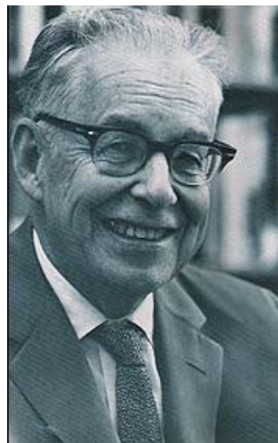
Fig. 2: Charles Richter (Fonte: pt.wikipedia.org/wiki/Charles_Francis_Richter )

Usada pela primeira vez em 1935, a referida escala que leva apenas o nome de um deles (Charles Richter) é uma escala logarítmica que quantifica a magnitude dos terremotos com base na amplitude das ondas sísmicas que se propagam a partir do epicentro (ponto de origem do sismo).