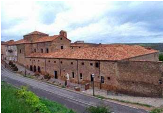
Convento da Imaculada Conceição em Ágreda.

Ouvindo as palavras de Madre Maria de Jesus, o padre missionário ficou emocionado. Para verificar a veracidade de seu relato, ele perguntou a ela questões específicas sobre a área, se ela poderia identificar certos pontos de referência e descrever os outros missionários, bem como índios específicos. "Ela contou-me muitas particularidades daquela terra que até mesmo eu havia esquecido, trazendo de volta à minha memória", ele observou. Ela também descreveu as características e traços individuais dos missionários e de vários índios, com detalhes que apenas quem já esteve na Nova Espanha poderia saber.