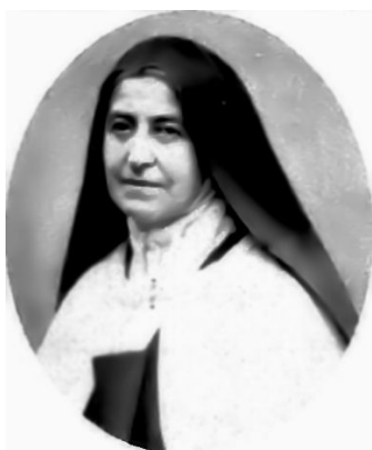
A Madrinha de Santa Teresinha

A irmã mais velha de Santa Teresinha, Maria Luísa Josefina (Soror Maria do Sagrado Coração), em sua infância e juventude, “sempre ciosa de sua liberdade, não lhe agradava a moda feminina da época; ficava irritada e chorava, até, quando a queriam vestida com esmero; ... dizia ela, 'todavia, nesse desprezo de toda faceirice devia haver orgulho secreto, pois, o orgulho se imiscui em toda parte, mesmo no que parece ser humilhante. Quando punha um vestido novo, isso era para mim um verdadeiro suplício' (Circular da Madre Inez de Jesus)” (“A Madrinha de Santa Teresinha”, Prefácio, p. 11, Editora Vozes Ltda, 1942)